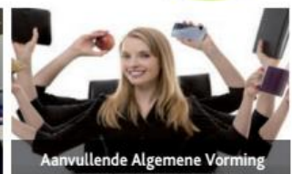
Aanvullende Algemene Vorming

GLTT Campus Rode Schoolstraat 2, 1640 Sint-Genesius-Rode ☎ 02 358 28 97 📠 02 358 44 24