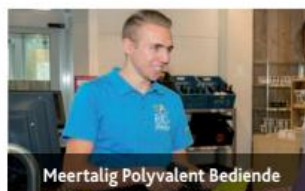
Meertalig Polyvalent Bediende

Infodag vrijdag 13 januari 2017 van 16-19u Campus Halle